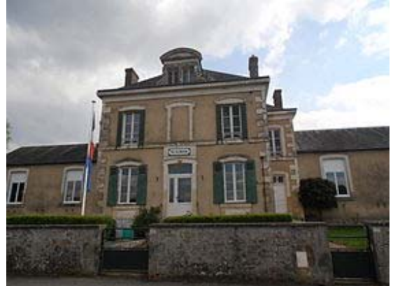
Mairie de Ligron