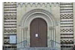
Église Saint-Pierre du Bailleul