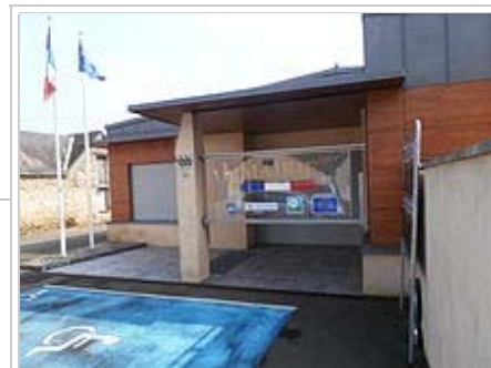
La mairie de la commune.