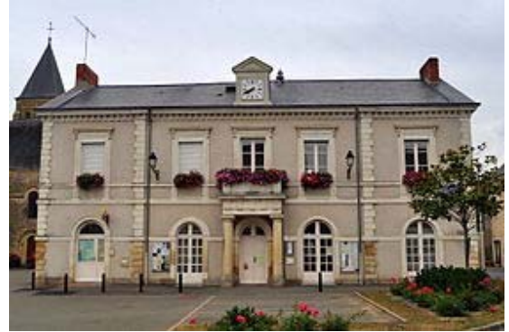
Mairie du Bailleul