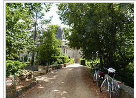
Le château de Bazouges