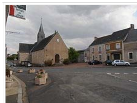
Centre de Ligron avec l'église.