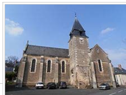
L'église de Mareil

En 2010, le revenu fiscal médian par ménage était de 28 539 €, ce qui plaçait Mareil-sur-Loir au 16 673 e rang parmi les 31 347 communes de plus de 50 ménages en métropole 16 . Selon l'enquête de l'Insee 17 , 52,4 % des foyers fiscaux de la commune étaient imposables en 2009.