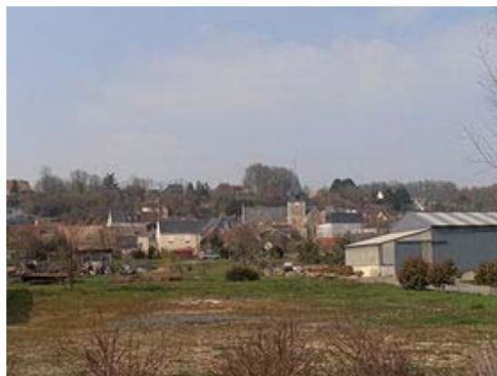
Vue de Mareil.