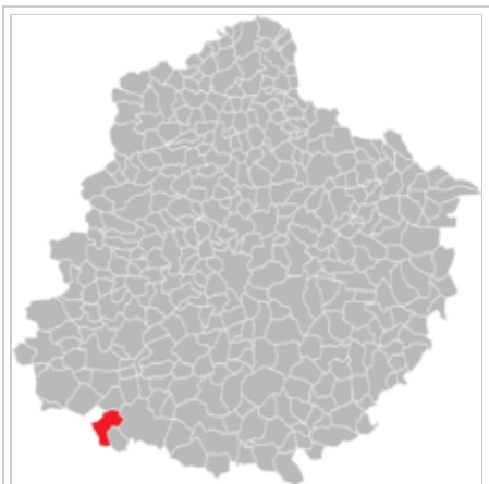
Situation de la commune de Bazouges-sur-le-Loir dans le département de la Sarthe.