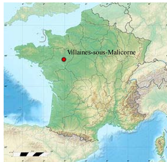
Voir la carte administrative de France

À l'est, le petit ruisseau l'Héritière sépare Villaines de la commune voisine de Bousse 5 . Trois autres cours d'eau prennent leur source sur le territoire communal. Au nord, le ruisseau de Coquelival se dirige vers Arthezé où il rejoint les eaux du Riboux 6 . Au sud-est, le ruisseau le Bois, affluent du Loir détermine la limite communale avec La Flèche 7 . Enfin, l'Argance, un autre affluent du Loir, prend sa source au centre de la commune 8 .