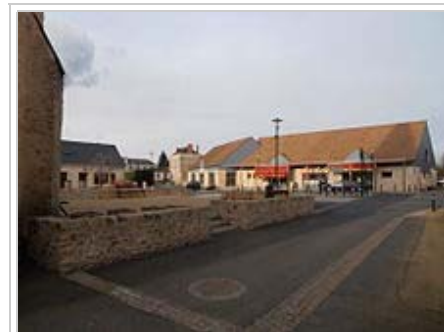
La place du village

Au 31 décembre 2010, Dissé-sous-le-Lude comptait 60 établissements : 22 dans l'agriculture-sylviculture-pêche, 4 dans l'industrie, 8 dans la construction, 23 dans le commerce-transports-services divers et 3 étaient relatifs au secteur administratif A3 . En 2011, quatre entreprises ont été créées à Villaines-sous-Malicorne A4 .