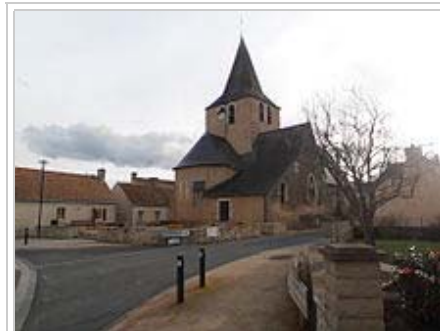
L'église vue de la place