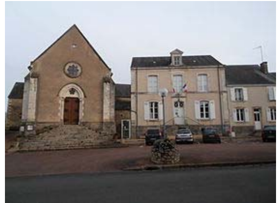
Place Saint-Aubin, l'église et la mairie