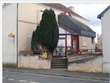
L'entrée de la mairie.