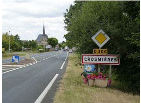
Entrée du bourg sur la départementale 306