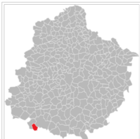
Situation de la commune de Cré dans le département de la Sarthe.

Flèche, ainsi que deux communes du Maine-et-Loire, Saint-Quentin-lès-Beaurepaire et Fougeré 3 .