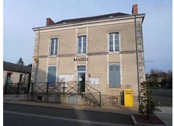
Mairie de Villaines