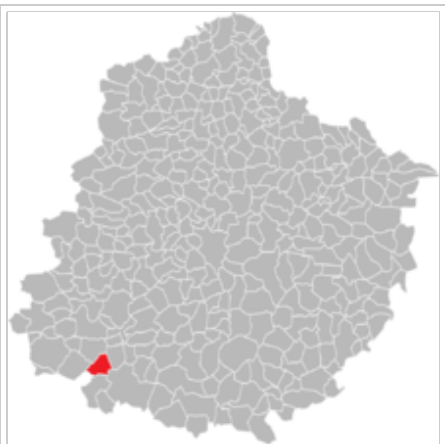
Situation de la commune de Crosmières dans le département de la Sarthe.