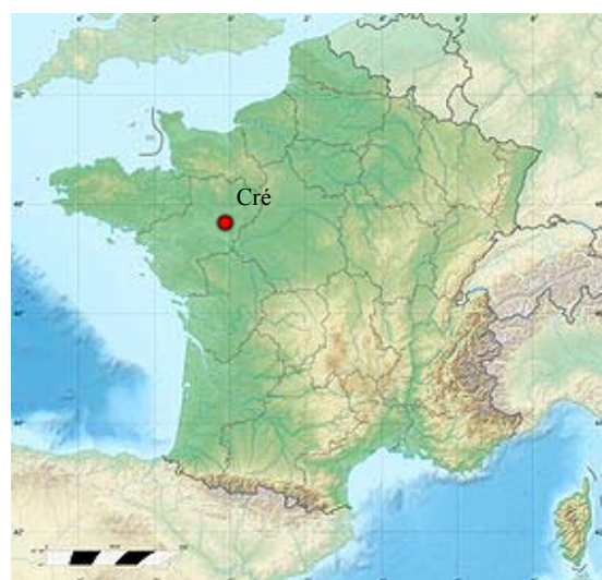
Voir sur la carte administrative de Sarthe Voir sur la carte topographique de Sarthe Voir la carte administrative de France